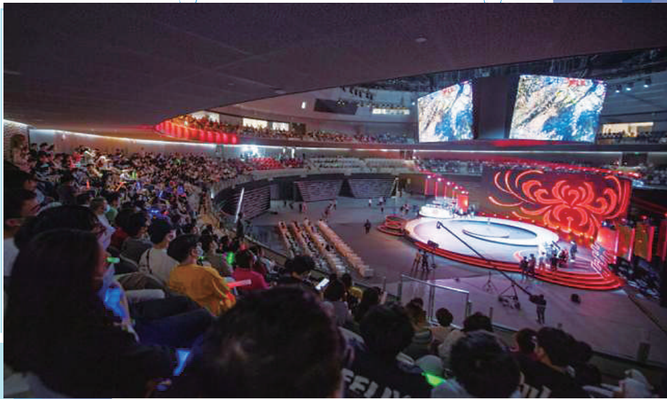
5月31日,市民和电竞爱好者在杭州电竞中心主竞赛场馆观看电竞比赛。

作为一个新专业,电竞专业近两年在越来越多高校开设,受到不少考生关注。“电竞专业是不是学打游戏?”“毕业是不是就是电竞选手?”……一些社交平台上,类似提问不少。这个专业教什么?就业情况如何?