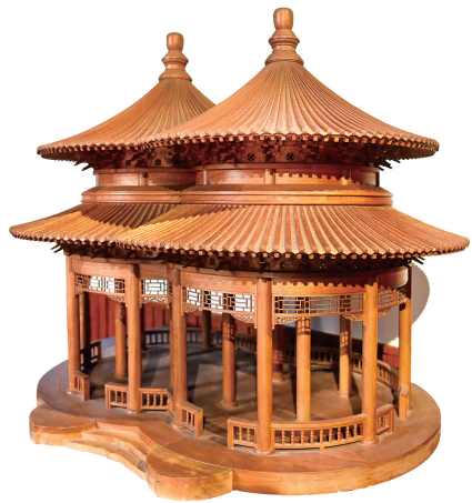
天坛双环万寿亭模型