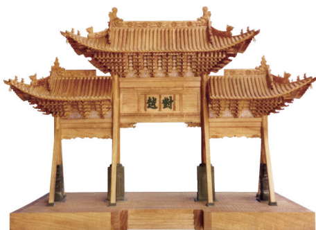
晋祠对越牌坊模型