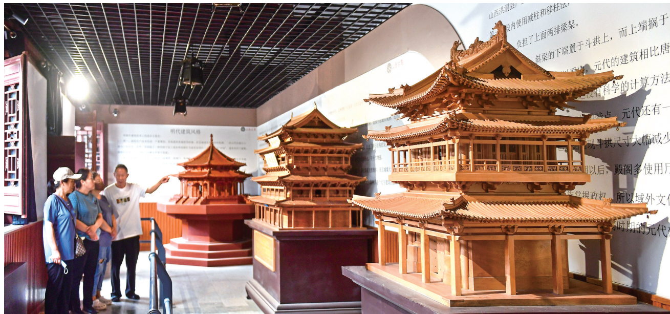
山西古典传统艺术博物馆“明作”展厅