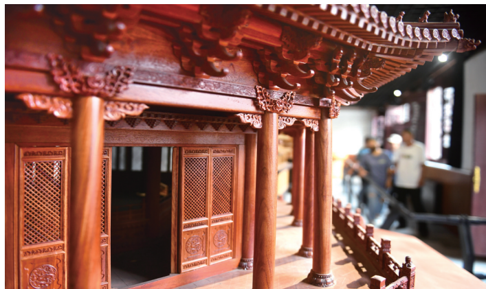
沈阳故宫大政殿模型(局部)

一凸一凹,集千年智慧;一转一折,汇世间美好。中国古建,是凝固的乐章,意化的诗篇。