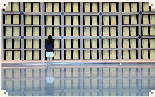
参观者在西安国家版本馆内参观