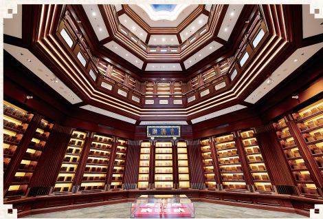
中国国家版本馆中央总馆文瀚阁文瀚厅