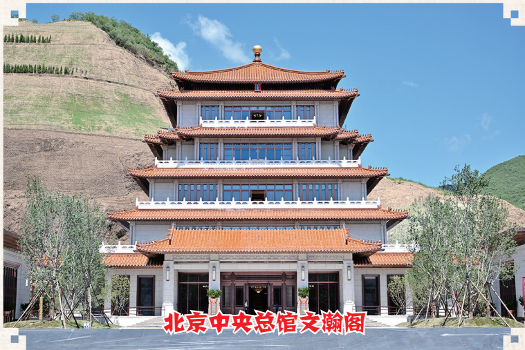
北京中央总馆文瀚阁

按照全面覆盖、门类齐全、突出重点、体现特色的原则,中国国家版本馆重点典藏彰显中华优秀传统文化、革命文化和社会主义先进文化的各类出版物版本、印刷版本、特殊版本、数字版本和外国版本,将古今中外载有中华文明印记的十大类版本资源纳入保藏范围。