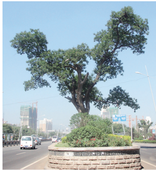
迎泽西大街下元附近明槐,历经几个世纪屹立不倒,附近下元社区、闫家沟社区、小井峪社区的老年人,口口相传着许多有关它的故事。

保护古树名木,不仅要关注其本身,还要改善其周边环境。一个最“现成”的方法就是,规划、建设公园、游园时,尽量就着古树名木,将其纳入其中。这样不仅拓宽了古树生长环境,延展了古树保护空间范围,而且提高了“活文物”的公众知晓度,提升了人们保护古树名木的意识。饮马河公园里的雪松、狄仁杰文化公园里的唐槐、唐槐公园里的唐槐,都是如此!“近年来,各城区每年新建游园、绿地,尽量遵循此原则!”市园林科创服务中心树木研究室谢兴刚说。此次普查中,谢兴刚参与了万柏林、杏花岭、尖草坪三区的调查工作。