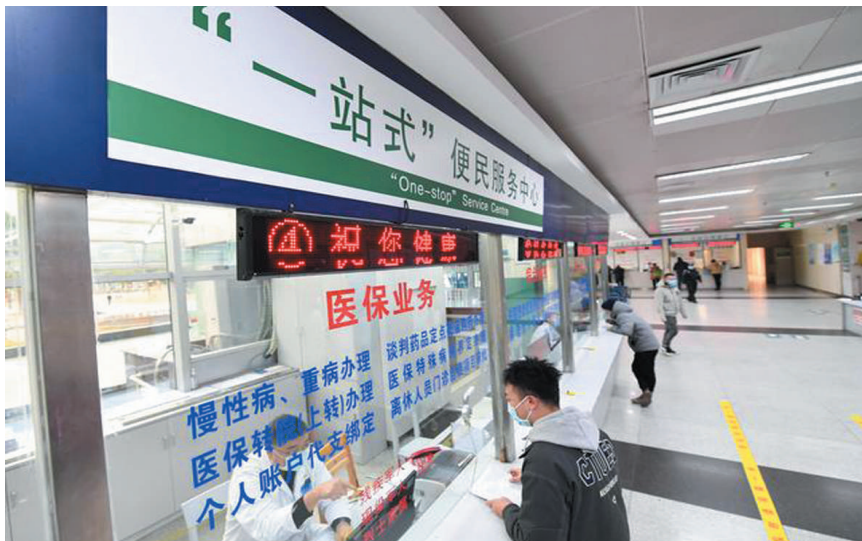
在广西柳州市人民医院“一站式”便民服务中心，工作人员为患者办理“一站式”结算。

国家医保局、财政部26日发布《关于进一步做好基本医疗保险跨省异地就医直接结算工作的通知》，跨省异地就医直接结算有了“新指南”。 新规将对参保人带来哪些影响？国家医保局相关负责人、医保专家作出解答。