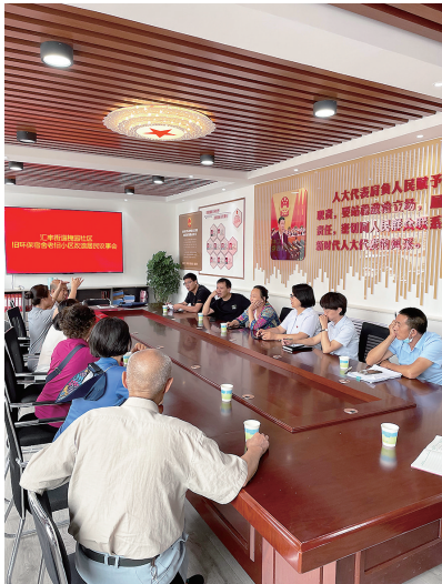
槐园社区老旧小区改造居民议事会。