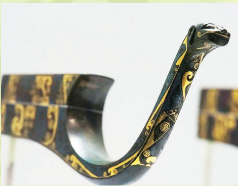
西汉时期的承弓器。