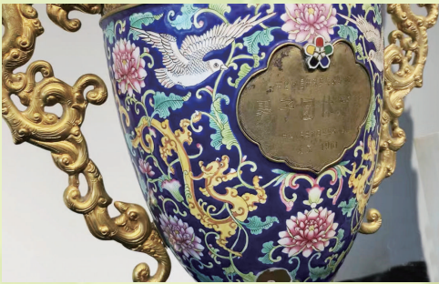
中国队首次获得世乒赛男团冠军奖杯。