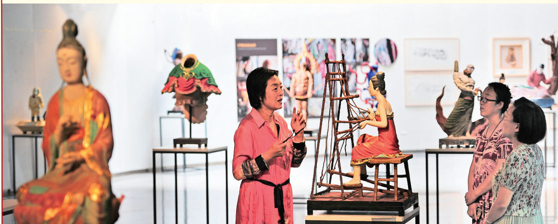
传统彩塑妆金(拔金)工艺的传承与创新人才培养项目实践成果展