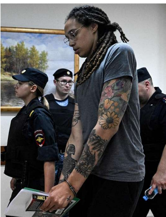
布兰妮·格里纳涉毒被逮捕。

据《体育画报》报道,根据俄罗斯的法律,格里纳遭到的指控最高可判处10年监禁——最终,俄罗斯检察官要求法院判处格里纳9年监禁,并处以100万卢布(约合人民币11.3万元)的罚款。