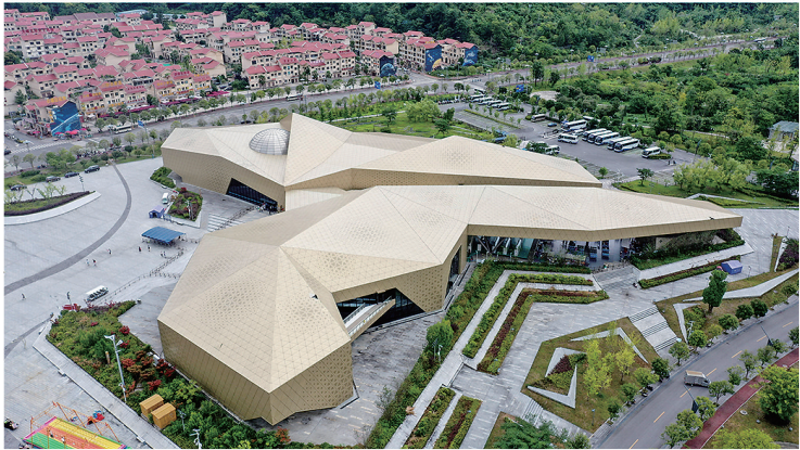
上图为2015年5月7日拍摄的天文体验馆建设现场。下图为2022年7月19日拍摄的天文体验馆。