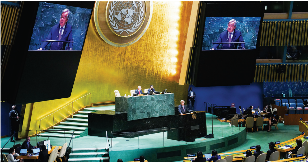
9月13日，在位于纽约的联合国总部，联合国秘书长古特雷斯在第77届联合国大会第一次全会上致辞。