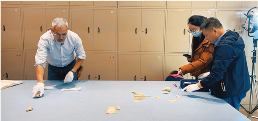
《何以中国》以考古引领,带着观众跨越万年时光,实证早期文明国家中国的发源和发展。

9月28日,正在拍摄和制作中的大型纪录片《何以中国》,将拿出一些珍贵的独家影像资料,在东方卫视以一档特别节目的方式,让观众先睹为快。《何以中国》总导演干超说:“譬如王家咀战国墓地出土的《孔子曰》,是最早的论语类文献;江陵马山一号墓所出的凤鸟花卉纹绣浅黄绢面锦袍,绮丽精美,而它只是墓内所葬贵族女性身上包裹的13层敛服中的第7层。”这档特别的演播室节目,将把考古成果与现代生活串联起来,勾勒出中国之智、之美、之情。