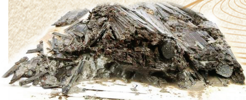
这是从王家咀798号战国楚墓中出土的珍贵竹简,总共约3200枚,内容分为3种,包括:《孔子曰》《诗经》和“乐”。

9月28日,正在拍摄和制作中的大型纪录片《何以中国》,将拿出一些珍贵的独家影像资料,在东方卫视以一档特别节目的方式,让观众先睹为快。《何以中国》总导演干超说:“譬如王家咀战国墓地出土的《孔子曰》,是最早的论语类文献;江陵马山一号墓所出的凤鸟花卉纹绣浅黄绢面锦袍,绮丽精美,而它只是墓内所葬贵族女性身上包裹的13层敛服中的第7层。”这档特别的演播室节目,将把考古成果与现代生活串联起来,勾勒出中国之智、之美、之情。