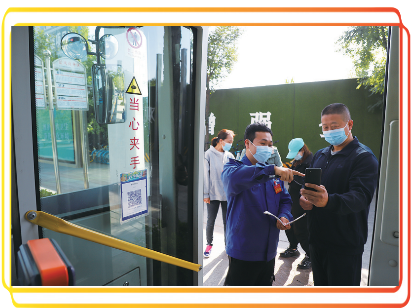
311路公交车司机正在为上车乘客认真仔细讲解如何使用“双码”小程序。

垫,请这位站起来一下、请那位调换个座位,几分钟时间就给老弱病残孕专座都系上了。刘大妈跟乘客们说,“311路司机是两个热心的小伙子,有时候给在城里上班的孩子捎点菜和粮食,他们总是笑呵呵的帮忙,只要能办到,从来不拒绝。现在入秋了,天越来越凉,想着给车上缝一些垫子,让两人,还有大家伙坐得舒服点,还不凉屁股!”看着这些用碎布、棉花做成的坐垫,听着刘大妈的一番话,大家伙不禁有些“小感动”。