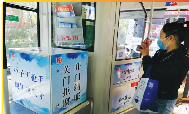
27路公交打造的“清风号”专线。

清风徐来,花自盛开。作为伴随了太原市民几十年的老牌线路,27路公交车见证了太原日新月异的发展,承载了市民的许多回忆。车厢植入廉洁元素后,27路公交车又增添了一股清新气息,乘客一上车就感觉“清风”扑面。