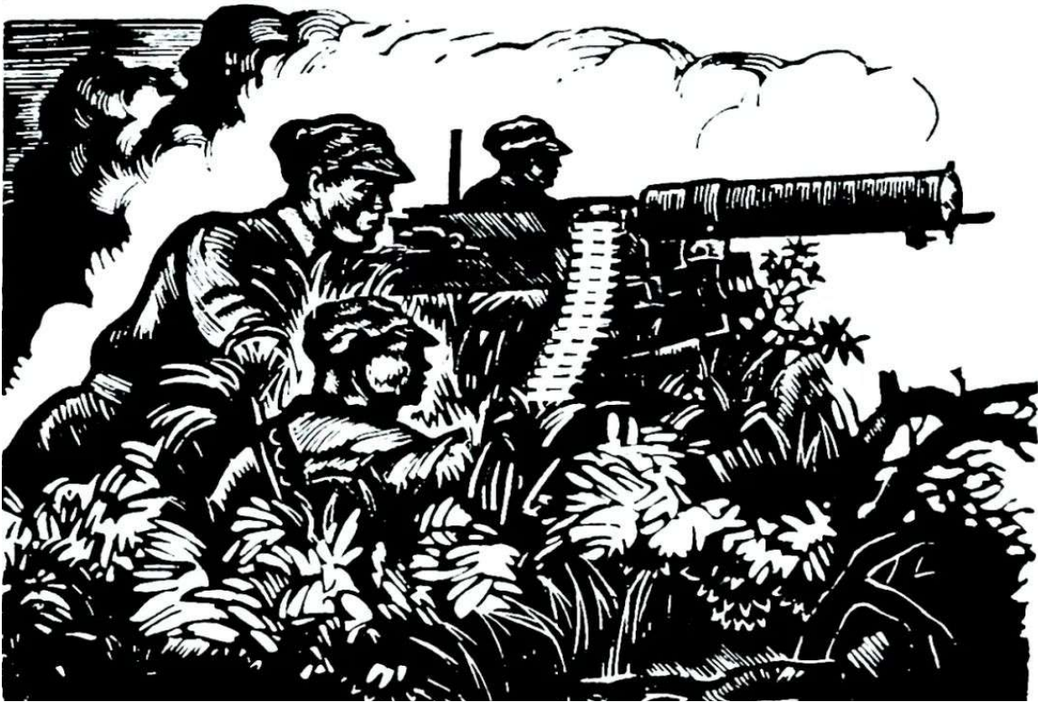
《抗战》 黑白版画 1937年