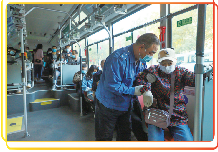
太原606路公交车司机正在帮助老年人安全落座。