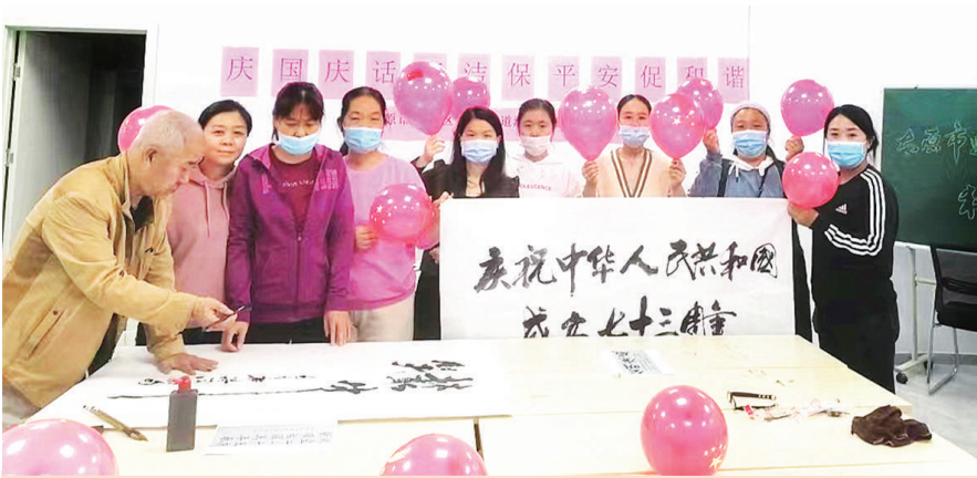
国庆期间,柳巷街道柴市巷社区同海西社区联合开展主题为“庆国庆 话廉洁 促和谐”活动,邀请辖区老人挥毫泼墨,社区还向居民派发了国庆主题气球。

执行、鉴定、信访各领域6个环节。在立案环节,实行强制检索制度,对重复诉讼案件、系列案件预警提示;在审判管理环节,开展“两级三评互动”质量评查,案件质量大幅提升;在司法鉴定环节,推行诉前鉴定和鉴前听证制度,打造便捷、阳光、权威的鉴定机制;在执行环节,实行“135”执行机制和“29221”执行工作法,最大限度保护胜诉当事人的合法权益;在信访环节,推行“1+7”信访工作模式,信访事项实质性化解形成闭环。