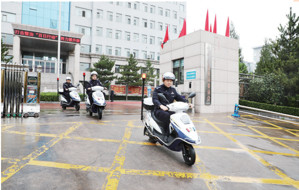
为进一步提升基层民警接处警巡防能力和快速反应打击违法犯罪能力,10月7日,记者从古交市公安局了解到,目前已有6辆警用电动车配发至基层派出所。民警、辅警骑上警灯闪烁、标志明显的警用电动车,充分发挥其多重功能,开展信息采集、“反诈”宣传、巡逻检查、疫情防控等基础工作,提升人民群众安全感和满意度。