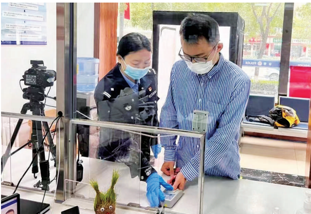
国庆节期间,三桥派出所户籍窗口便民服务“不打烊”,为急需办理户籍业务的群众提供便捷、高效的服务,获得了广泛好评。图为民警为群众补办身份证。