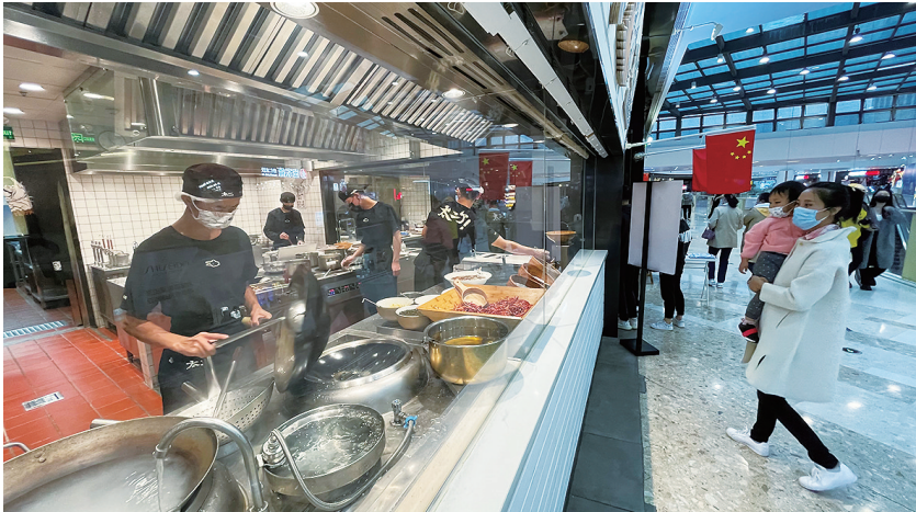
10月8日，省城某商场内，“透明”厨房吸引着消费者隔着玻璃观看餐食的制作过程。随着消费者对食品安全关注度的提高，餐饮店开始通过“展示厨房”的方式迎合消费者的需求。

品牌店，两位导购正在柜前进行线上直播，试穿、介绍、打包，忙得不亦乐乎。导购小薛说，“疫情之下，我们必须学会如何用短视频和直播变现。店员对大部分老顾客的喜好和身材都非常了解，会重点推荐适合她们的款式。” 10月是服装换季销售的旺季。在这个档期，销旧款、铺新款，是各家的主要工作。“市场正常经营，我们就要努力起来。”5楼销售女装的商户张先生说，“疫情对服装行业的影响挺大，不过各行各业都有这样的焦虑。面对变化和损失，我觉得还是要坚持并做更多尝试，才会有更多希望。” 在困难中找出路，在坚持中寻转机。众多普普通通的经营者，正带着这样一种力量，努力前行。记者 梁丹