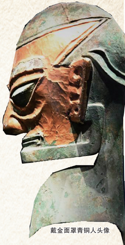
戴金面罩青铜人头像