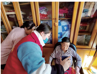
一年一度的养老保险金资格认证工作又开始了。在纺织苑东社区,很多老年人因为不会使用智能手机,纷纷向社区求助。连日来,社区干部、网格员们登门入户,帮助辖区高龄老人进行认证操作,截至目前已帮助35位老人完成认证。