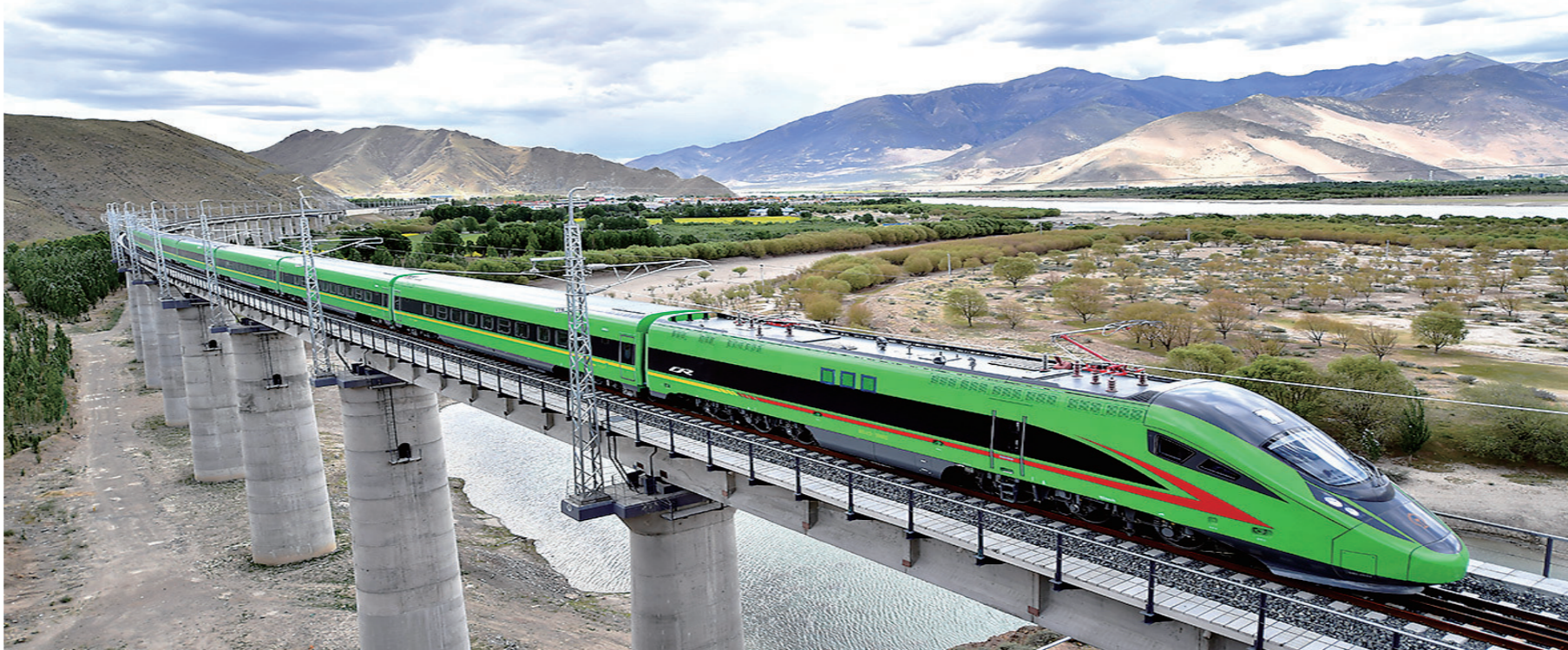
2021年6月25日,全长435公里、设计时速160公里的拉林铁路建成通车,西藏首条电气化铁路建成,同时复兴号实现对31个省区市全覆盖。这是2021年6月16日拍摄的试运行的复兴号列车行驶在西藏山南市境内。