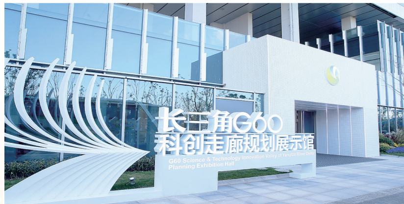
这是2020年11月18日拍摄的位于上海市松江区的长三角G60科创走廊规划展示馆外景。

党的十八大以来,以习近平同志为核心的党中央带领人民,采取一系列战略性举措,推进一系列变革性实践,实现一系列突破性进展,取得一系列标志性成果,推动党和国家事业取得历史性成就、发生历史性变革。