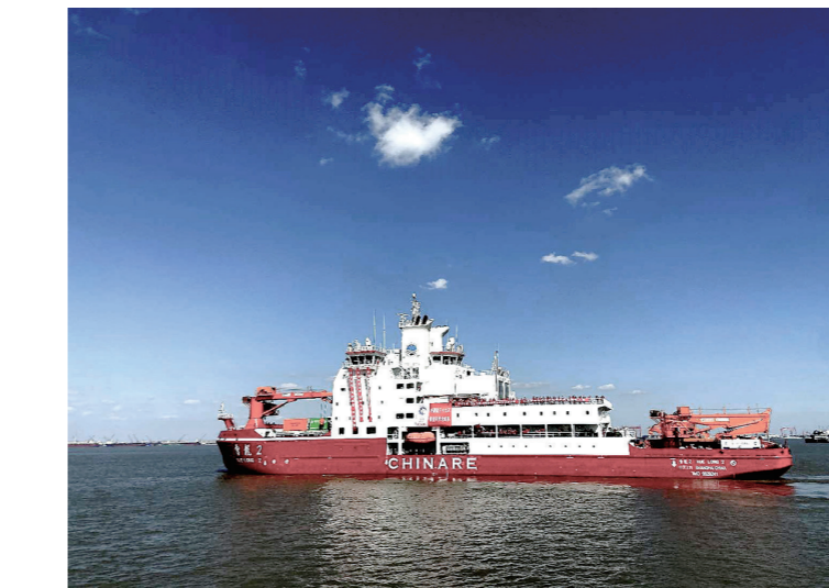
2020年11月10日,中国第37次南极科学考察队乘坐“雪龙2”号极地科考破冰船从上海启航,奔赴南极执行科学考察任务。

英国学者马丁·雅克认为,中国提供了一种“新的可能”,开辟了一条合作共赢、共建共享的文明发展新道路。这是前无古人的伟大创举,也是改变世界的伟大创造。