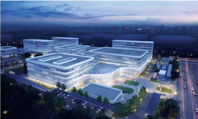
图为新建院区的效果图

植总例数突破3000例,始终占据我省肾脏疾病一体化管理、器官移植的核心引领地位。 据介绍,新院区落户我市小店区郑村,按照总体规划分期建设的思路,一期占地70亩,建筑面积近7万平方米,规划设置床位400张,总投资6.1亿元。建成后,将填补周边五公里内无大型三甲医院的空白,医疗服务辐射太原、晋中两地,并依托该院现有人才和技术优势,为太原武宿国际机场、太原南站等交通枢纽周边和人员密集场所突发疫情和重大公共卫生事件提供及时有效的医疗保障。作为山西省重点工程,该项目将成为我省化学中毒救治基地、省级职业病防治中心,形成防、控、治、研为一体的职业病防治、急救救治体系,进一步增强我省职业病防治能力和化学中毒救治能力,填补我省在化学中毒救治领域的空白点,提升我省公共卫生服务能力。