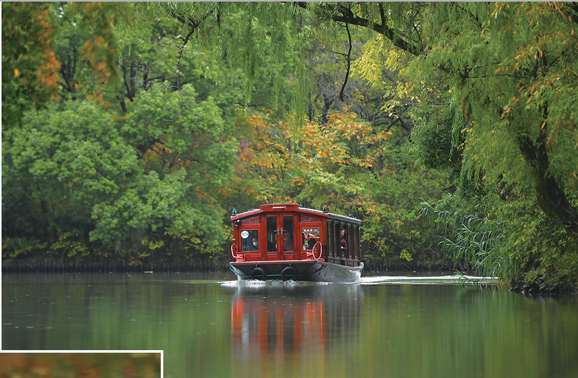
10月28日，游客乘坐电瓶船在西溪国家湿地公园观光。

秋日的杭州，穿过车水马龙、熙攘人流，来到城市西北部，港汊纵横，芦花飞雪，火红的柿子好像一盏盏小灯笼挂在枝头，绿头鸭和苍鹭飞过水面，普陀鹅耳枥等珍稀植物静静舒展枝叶，一派“万类霜天竞自由”的景象。 这里是中国第一个国家级湿地公园——杭州西溪国家湿地公园。10年来，西溪湿地动植物增加了近700种，成为飞鸟、鱼类、昆虫和草木的天堂。