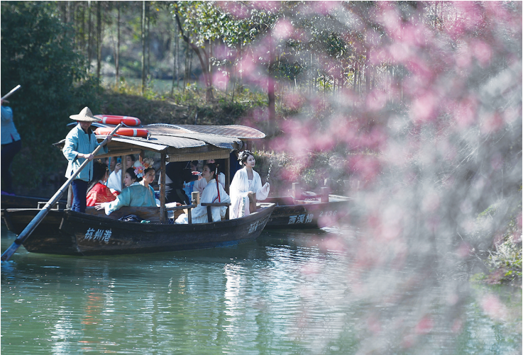
2021年2月21日，汉服爱好者在杭州西溪国家湿地公园乘坐摇橹船赏梅。

境优化结硕果，生态功能持续加强，近年来吸引了不少珍稀“明星鸟”飞来落户，引种的珍稀濒危植物也“适彼乐土”。漫步湿地，你可能与国家一级保护动物青头潜鸭、白尾海雕擦肩而过，也可能偶遇“鸟界国宝”东方白鹳和“东方宝石”朱鹮。 西溪湿地生态文化研究中心副主任刘想介绍说，湿地有柿基、桑基、竹基“三基鱼塘”构成良性循环的生态系统。10年来湿地动植物增加了696种，其中维管束植物增加了474种，现有1040种；鸟类增加了43种，现有196种；鱼类增加了6种，现为56种。 水是湿地的灵魂。杭州市近两年开展了珊瑚沙引水清水入城和西溪湿地水环境治理等工程，监测显示，西溪水质从2012年在三类、四类水之间徘徊，到如今常年总体达到三类，核心区域稳定在二类。