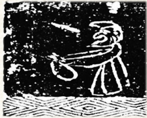
南阳新野幻人吐火图画像石