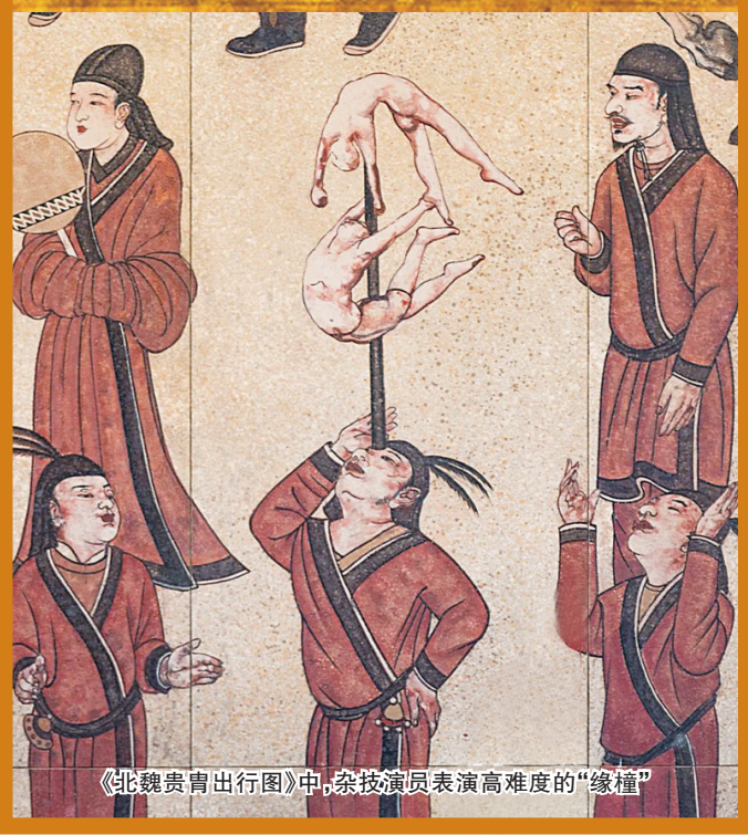
《北魏贵胄出行图》中,杂技演员表演高难度的“缘橦”

水秋千以秋千为跳板,荡到最高处时,表演者就会跳离秋千,做出不同的花式动作,翻身入水。这看起来和今日的跳水项目较为类似,但其实比现代跳水难度系数更高。这是因为起跳处不是固定的跳板,而是在不断活动着的秋千板,这就对起跳的时机把握有严格要求,观赏价值也比较高。据《大河报》