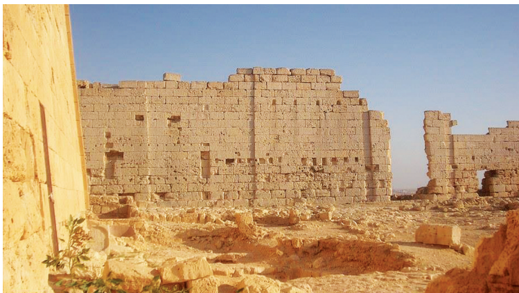
塔波西里斯·马格纳神庙,其名字的意思是“奥西里斯大墓”。

塔普西里斯马格纳的意思就是“奥西里斯的伟大陵寝”,而伊西斯女神和奥西里斯神被埋葬在这里,不管是宗教还是政治上,对古埃及人来说,都有更重要的意义。 据人民网、《潇湘晨报》