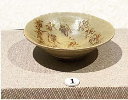
住在绿池边，朝朝学采莲。 水深偏责就，莲尽更移缸。

“住在绿池边，朝朝学采莲。水深偏责就，莲尽更移缸。”这首不见于《全唐诗》的唐诗，是唐代长沙窑精美瓷器上诸多唐诗的一个缩影。根据了解，目前已发现的长沙窑器物题写各种诗句110首，有100首不见于《全唐诗》。