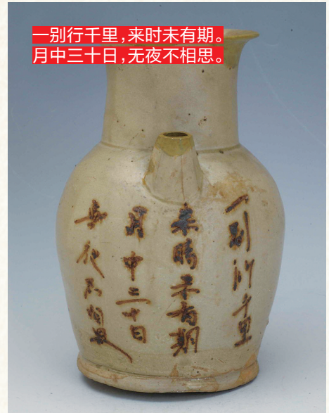
一别行千里，来时未有期。 月中三十日，无夜不相思。