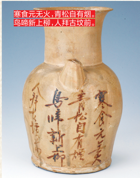
寒食元无火，青松自有烟。 鸟啼新上柳，人拜古坟前。