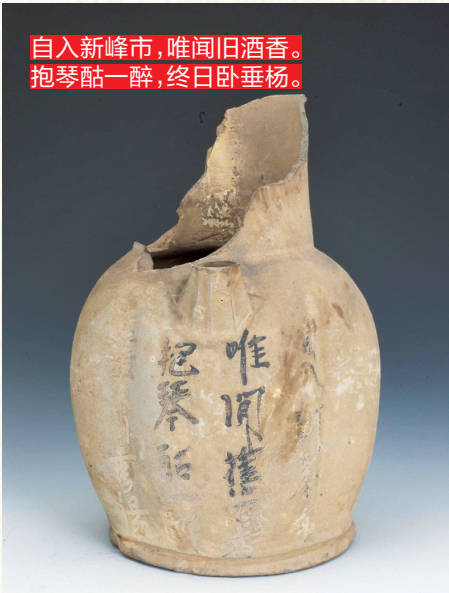
自入新峰市，唯闻旧酒香。 抱琴酤一醉，终日卧垂杨。