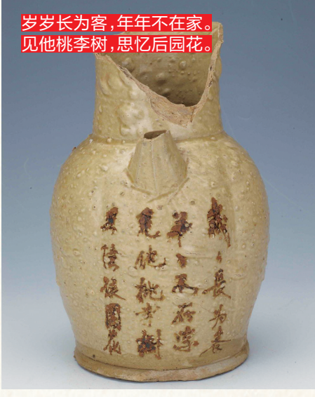
岁岁长为客，年年不在家。 见他桃李树，思忆后园花。