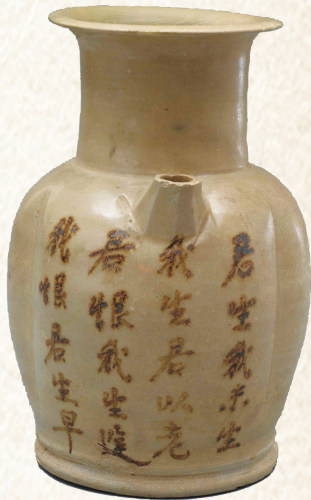
君生我未生，我生君以老。 君恨我生迟，我恨君生早。