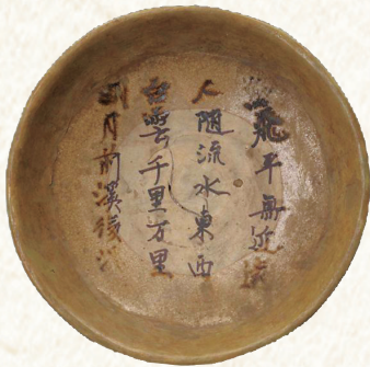
鸟飞平无近远，人随流水东西。 白云千里万里，明月前溪后溪。