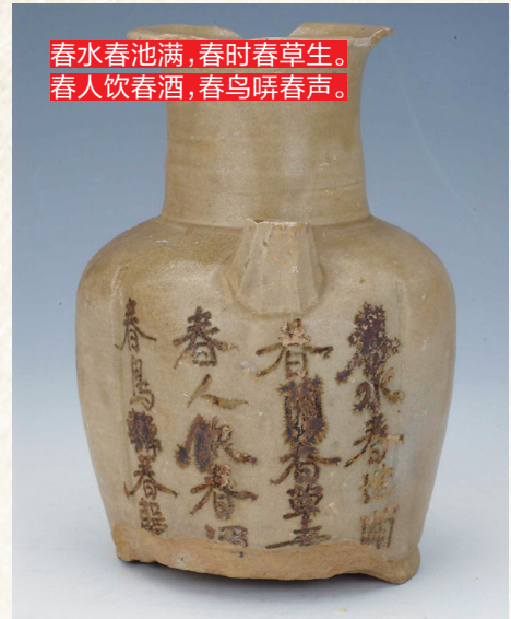
春水春池满，春时春草生。 春人饮春酒，春鸟啁春声。