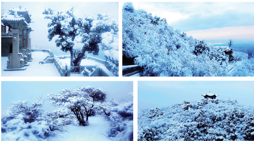
银装(组照) 作者:王春雷