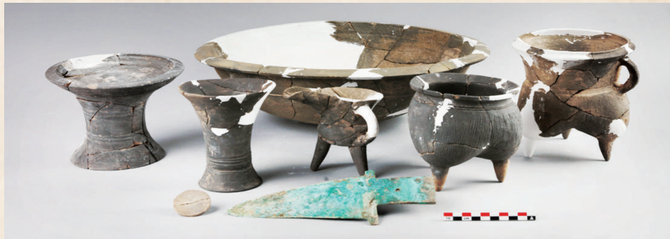
洹北商城工匠墓M54随葬器物组合。

中国社会科学院学部委员、中华文明探源工程首席专家王巍表示,殷墟上承四方汇集文明之趋势,下启连续不断、多元一体文明之格局,是中华文明进程中非常重要的环节。