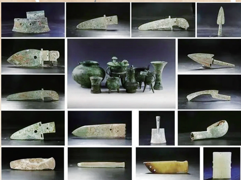
陶家营商代中期环壕聚落遗址M12出土器物组合。