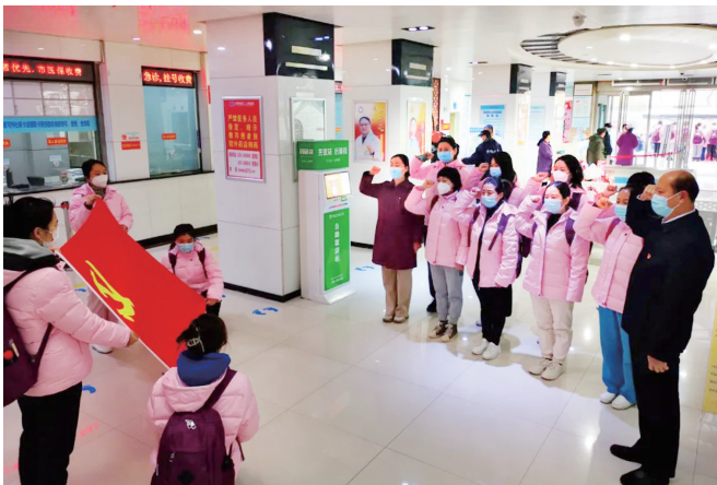
图为市二院成立方舱临时党支部,14名党员在党旗面前庄严宣誓。

本报讯(记者 魏薇 通讯员 帅慧荣 文/摄)疫情就是命令,防控就是责任。11月27日早8时,市第二人民医院73名医护人员紧急集合,组成紧急医疗救援队奔赴疫情防控一线——晋阳湖国际会展中心方舱医院。在全市众志成城同心抗击疫情的关键节点,市卫健委下达紧急驰援方舱医院的任务后,市二院广大医务人员积极响应、主动请缨、迅速集结,表示要继续奋战一线,与全市人民一道全力抗击疫情。紧急集结后,市二院在住院楼前举行了简短的出征仪式,每名队员都有坚定的信心和必胜的信念。大家纷纷表示,一切行动听指挥,迅速融入新环境,充分发挥专业特长,坚持科学防控,规范开展救护,圆满完成医疗救治任务,尽心尽责完成支援方舱医院