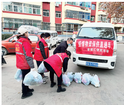
图为前进路北社区的网格员、志愿者从保供直通车上卸下居民“点单”的蔬菜。

本报讯(记者 李涛 通讯员 王湘 文/摄)“我要白菜、韭菜、西红柿各1斤。”“我家需要2斤胡萝卜、1斤菠菜”……每天,网格群里,小区居民会挨个“接龙”,报上想要的蔬菜。随即,一辆“保供直通车”会载着一袋袋分装好的蔬菜驶入社区,再由网格员、志愿者认领后分别送到居民家门口。11月28日万柏林消息,疫情期间,前进路北社区主动对接居民需求,畅通末端保供“最后一米”,凸显了民生服务的温度。前进路北社区辖区有6