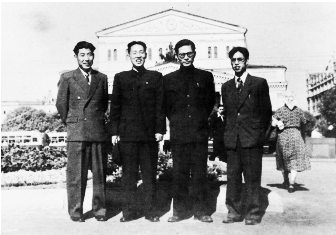
1955年至1956年,江泽民同志(右二)曾在莫斯科大林汽车制造厂实习。这是江泽民等在莫斯科合影。