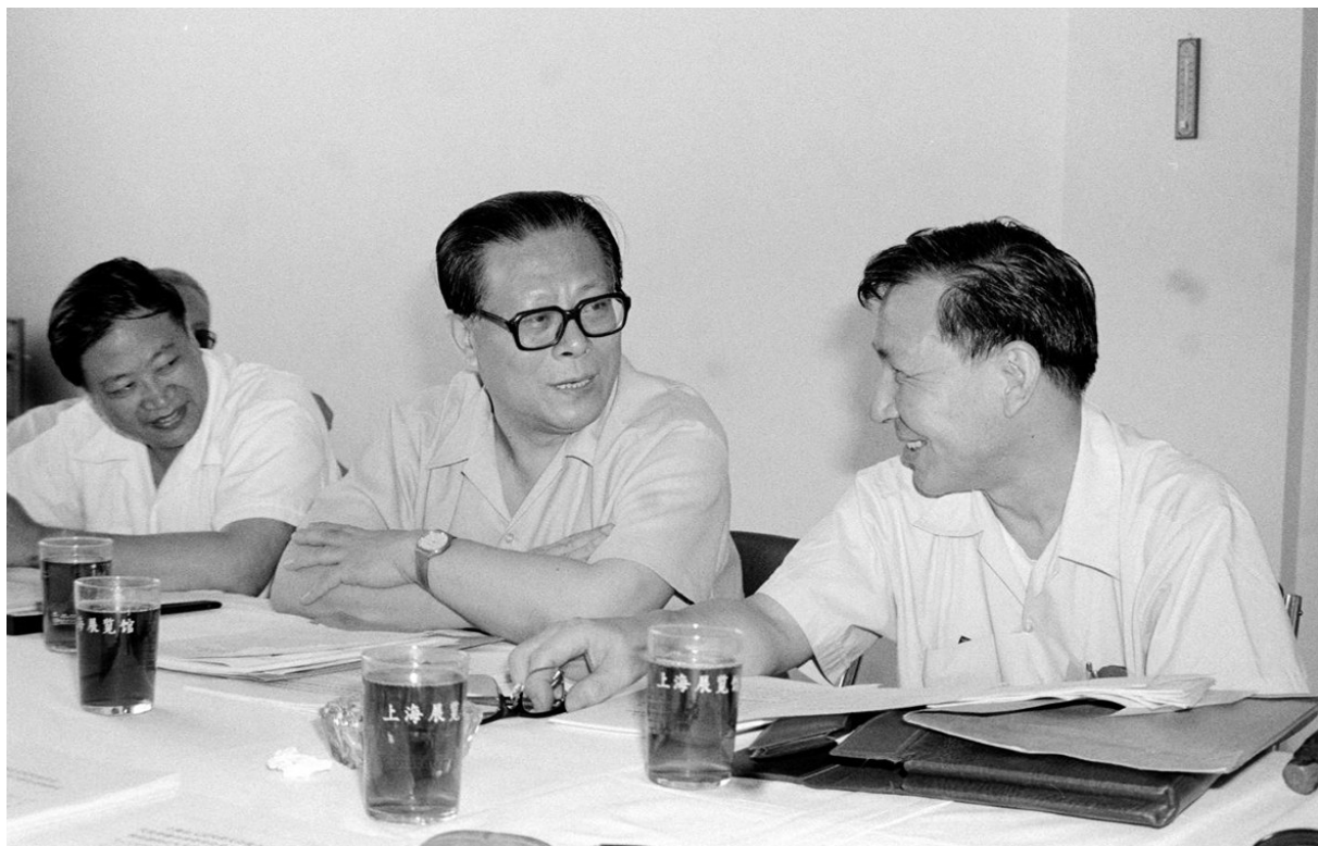
下图为1985年,江泽民同志在上海市八届人大四次会议上。

建设与经济建设协调发展的方针,在经济发展的基础上推进国防和军队现代化,尽快形成自己的高技术武器装备的“杀手锏”。