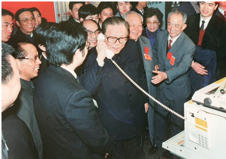
1984年5月,江泽民同志在北京展览馆举行的全国电子新产品展览会上,试用国际长途电话向远方的工作人员问候。