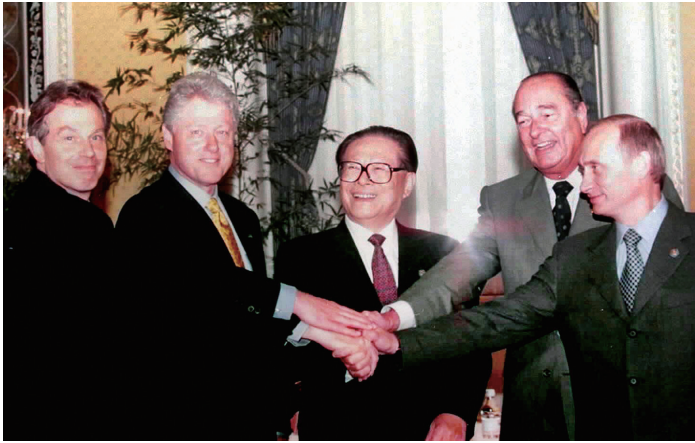
上图：2000年9月7日，由中国倡议的联合国安理会五个常任理事国首脑会议在纽约举行。江泽民同志（中）同法国总统希拉克（右二）、俄罗斯总统普京（右一）、英国首相布莱尔（左一）、美国总统克林顿（左二）握手合影。