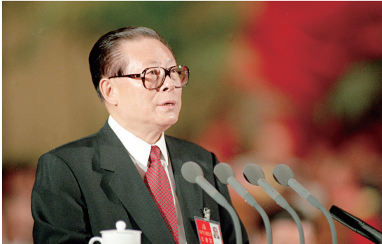
上图：1997年9月12日，中国共产党第十五次全国代表大会在北京人民大会堂开幕。这是江泽民同志代表第十四届中央委员会作报告。