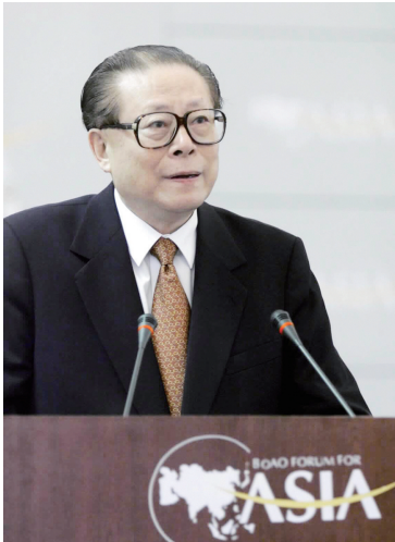
上图：2001年2月27日，博鳌亚洲论坛成立大会在海南举行。江泽民同志出席成立大会并致辞。