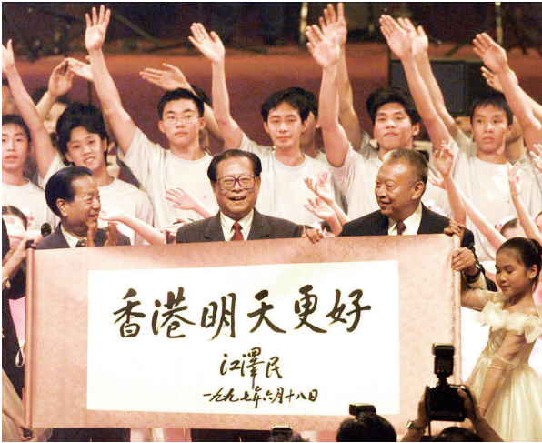
上图：1997年7月1日上午10时，中华人民共和国香港特别行政区成立庆典在香港会展中心新翼举行。在庆典仪式上展示了江泽民同志亲笔题写的“香港明天更好”书法卷轴。