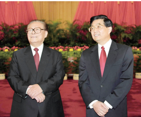
左图：2002年11月15日，江泽民同志、胡锦涛同志在北京人民大会堂亲切会见出席党的十六大代表、特邀代表和列席人员并发表重要讲话。