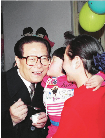
右图：1993年12月5日，江泽民同志在北京为一位幼儿园儿童喂服脊髓灰质炎疫苗后，小朋友亲吻江爷爷。