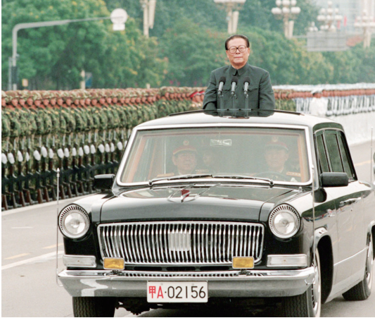
上图：1999年10月1日，中华人民共和国成立50周年盛大庆典在北京天安门广场举行。江泽民同志检阅由人民解放军陆海空三军和人民武装警察部队、民兵预备役部队组成的地面方队。