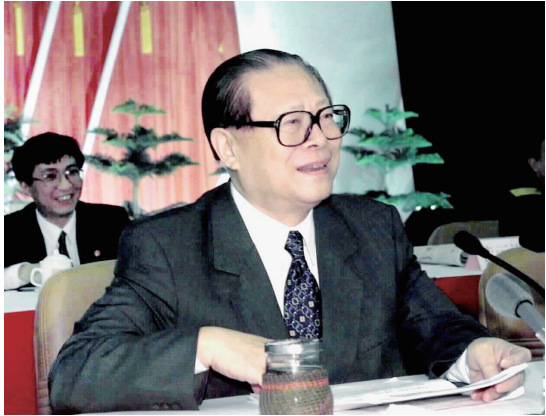
上图：2000年2月20日，江泽民同志在广东省高州市领导干部“三讲”教育会议上发表重要讲话。在这次广东考察中，江泽民同志提出，我们党总是代表着中国先进生产力的发展要求，代表着中国先进文化的前进方向，代表着中国最广大人民的根本利益。