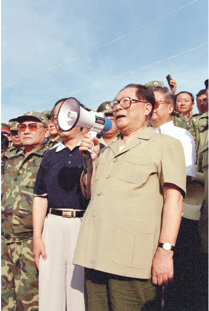
左图：1998年8月13日至14日，江泽民同志亲赴湖北长江抗洪抢险第一线，看望、慰问、鼓励奋战在抗洪抢险第一线的广大军民，指导抗洪抢险斗争。这是8月13日江泽民同志在洪湖市乌林镇中沙角险段大堤上，向正在抗洪抢险的军民发表讲话。