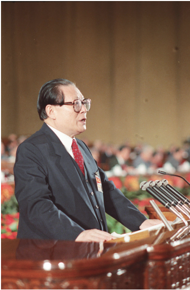
左图：1992年10月12日，中国共产党第十四次全国代表大会在北京人民大会堂开幕。这是江泽民同志代表第十三届中央委员会作报告。