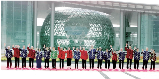
左图：2001年10月21日，亚太经合组织第九次领导人非正式会议在上海举行。这是江泽民同志与参会的经济体领导人合影。