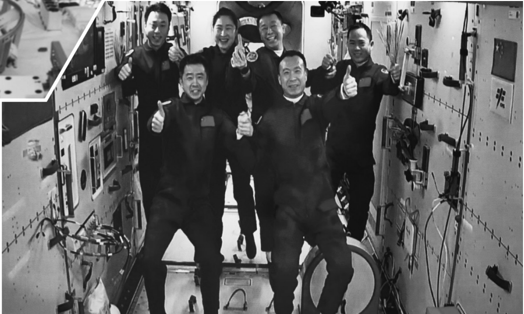
11月30日在酒泉卫星发射中心拍摄的神舟十五号航天员乘组与神舟十四号航天员乘组太空合影的画面。