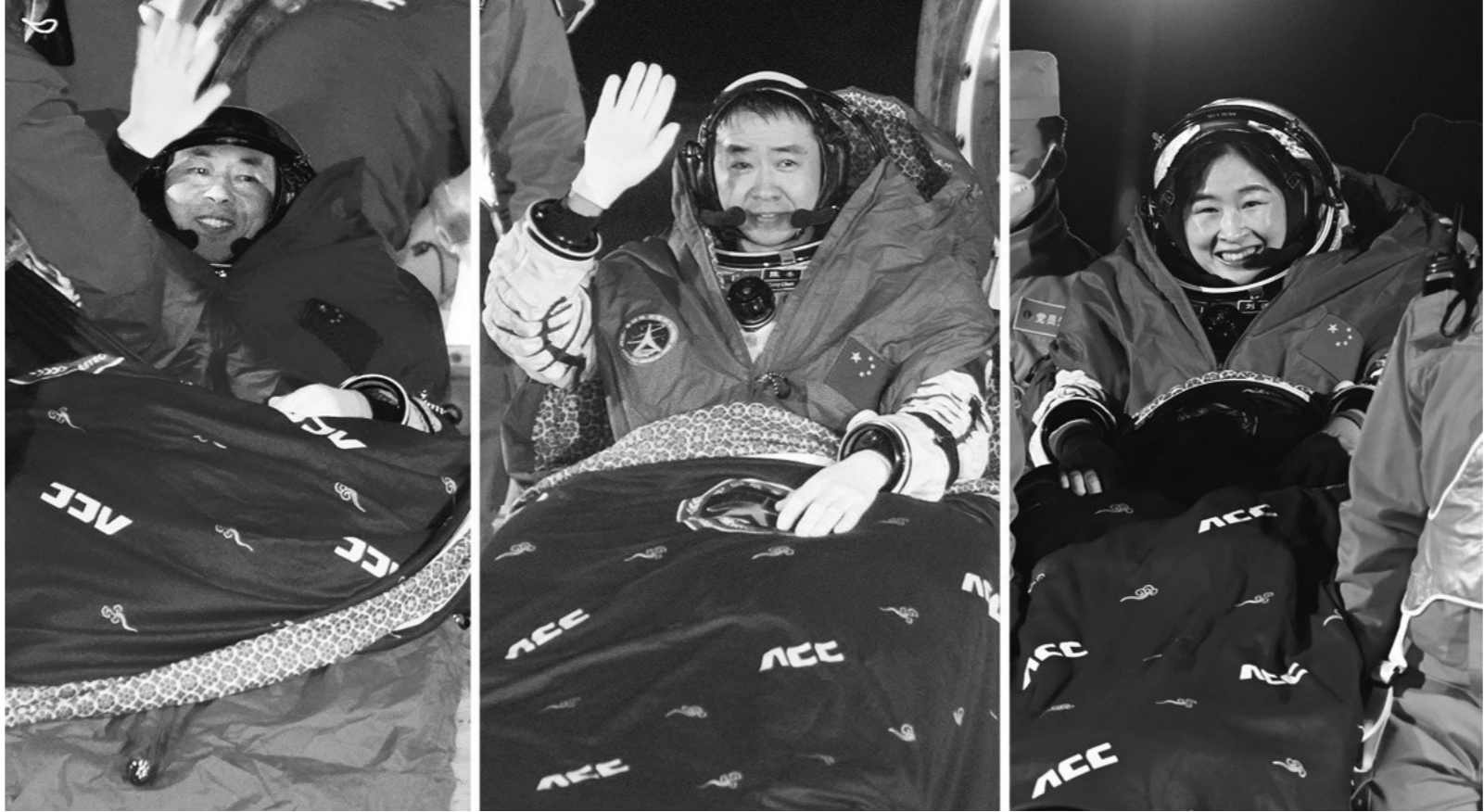
12月4日,神舟十四号载人飞船返回舱在东风着陆场成功着陆。这是航天员陈冬(中)、刘洋(右)、蔡旭哲安全顺利出舱。