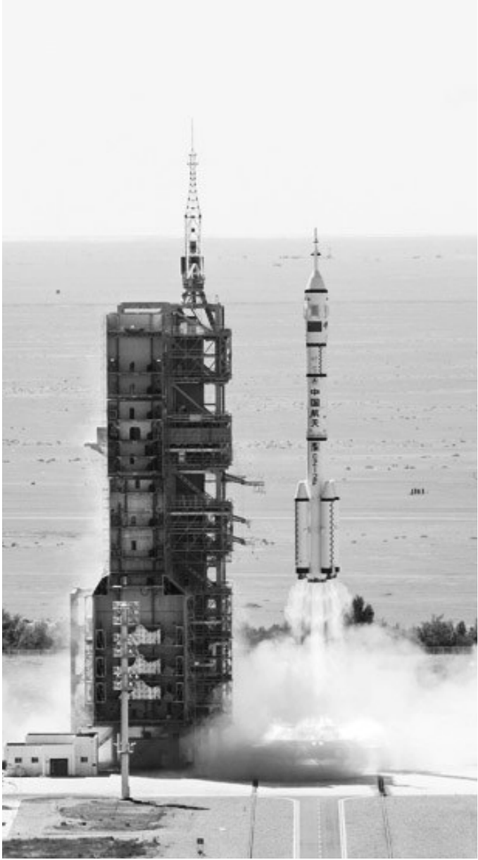
6月5日,搭载神舟十四号载人飞船的长征二号F遥十四运载火箭,在酒泉卫星发射中心点火发射。