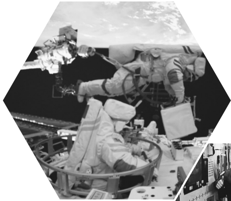
9月1日在北京航天飞行控制中心拍摄的航天员陈冬(上)、刘洋(下)开展舱外操作的画面。

快速交会对接于天和核心舱前向端口,加上问天、梦天实验舱,神舟十四号、天舟五号飞船,中国空间站首次形成“三舱三船”组合体,达到当前设计的最大构型,总重近百吨。