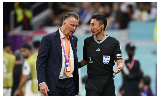
马宁和范加尔谈笑风生。

12月8日,国际足联官方公布了本届杯赛剩余比赛执法裁判员名单,中国裁判马宁、助理裁判员曹奕、施翔的名字均不在名单之列,这意味着他们的卡塔尔世界杯之旅已经结束。