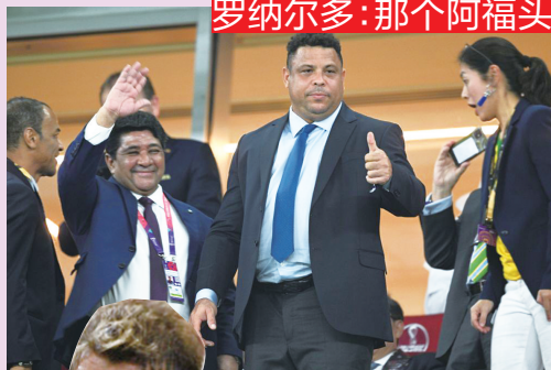
罗纳尔多:那个阿福头是青春代言人

出现在看台上的卡卡,依旧赏心悦目,仿佛在球场上奔袭的身影,就在昨天,2010 年南非世界杯,巴西 vs 科特迪瓦,卡卡接应“甜酸”,得到红牌后他笑着走下场,但笑着笑着就哭了。