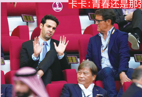
卡卡:青春还是那张帅气的脸

斯内德圆滑的脸庞,实在令人唏嘘。三届世界杯,2010 年的南非最心碎。倒在距离冠军最近的地方,也错失当年的金球奖。斯内德的泪水令人无法释怀。