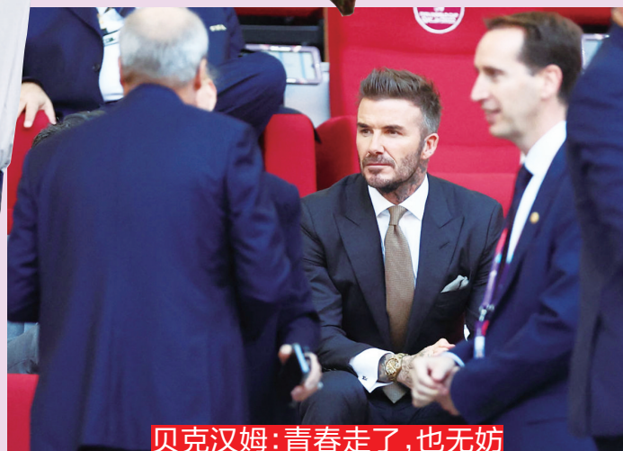
贝克汉姆:青春走了,也无妨

20 年前,还是在亚洲,罗纳尔多在自己的第三届世界杯上,再次捧起大力神杯,难忘那个阿福头,难忘当年的兔牙笑容。