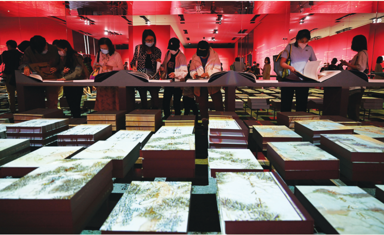
2022年9月29日,参观者在中国国家博物馆观看“盛世修典——‘中国历代绘画大系’成果展”。