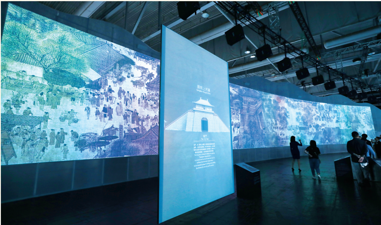
2019年7月26日,参观者在香港亚洲国际博览馆内观看《清明上河图3.0》数码艺术香港展。