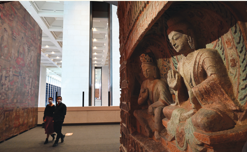
2022年9月29日,参观者在中国国家博物馆的“盛世修典——‘中国历代绘画大系’成果展”上观看等比例高保真数字化3D打印复制的云冈石窟第6窟南壁“文殊问疾”展形龕。