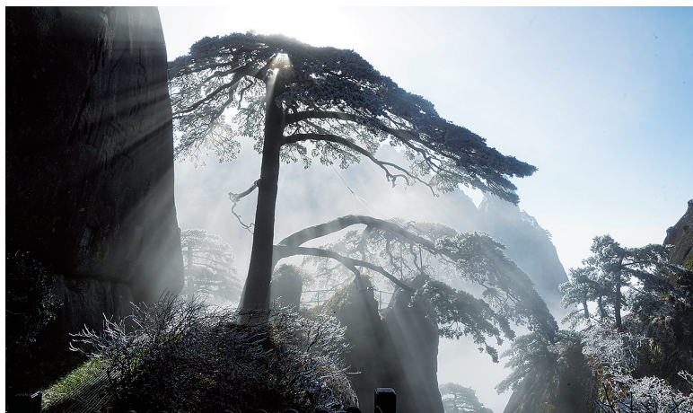
这是李培生拍摄的黄山迎客松(2022年12月11日摄)。