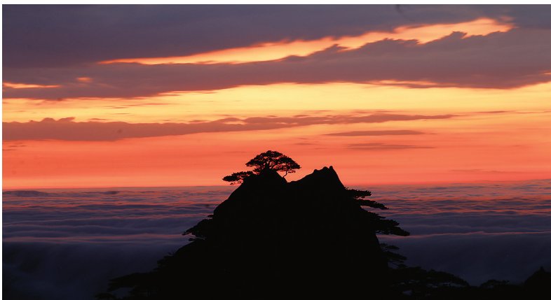
这是李培生拍摄的黄山风景(2022年11月16日摄)。