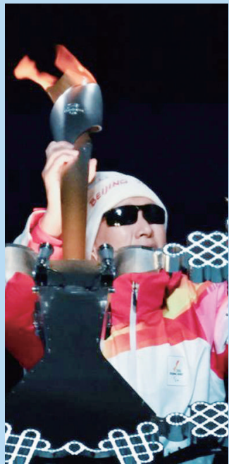
北京冬残奥会最后一棒火炬手、盲人运动员李端。