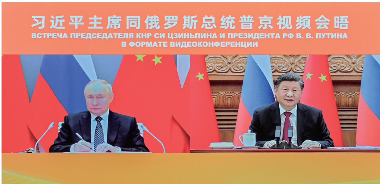
12月30日下午，国家主席习近平在北京同俄罗斯总统普京举行视频会晤。

习近平强调，当前，世界又一次站在历史的十字路口。是重拾冷战思维，挑动分裂对立、集团对抗，还是从人类共同福祉出发，践行平等互尊、合作共赢，这两种取向考验大国政治家的智慧，也考验全人类的理性。事实反复证明，围堵打压不得人心，制裁干涉注定失败。中方愿同俄方以及全世界所有反对霸权主义和强权政治的进步力量一道，反对任何单边主义、保护主义、霸凌行径，坚定捍卫两国主权、