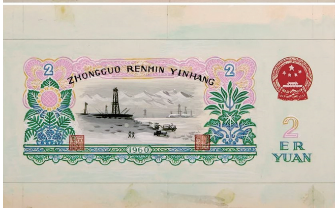
1950年至80年代周令钊担任建国后第二、三、四套人民币总体设计,图为第三套人民币2元票面总体设计图 5.5cm×13cm,1960年