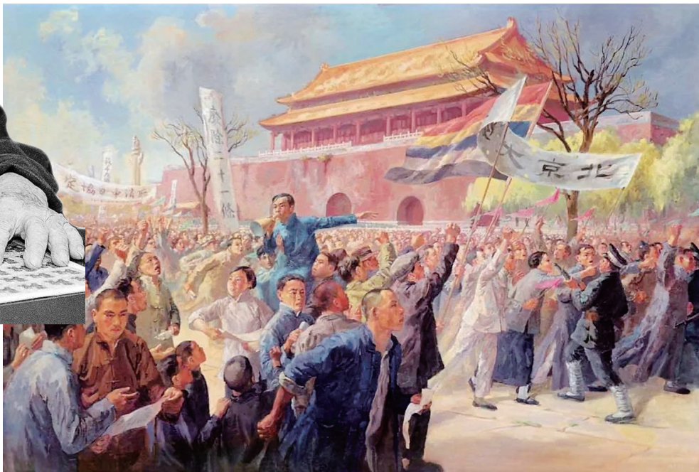
周令钊 《五四运动》 油画 155×236cm 1951年 中国国家博物馆藏