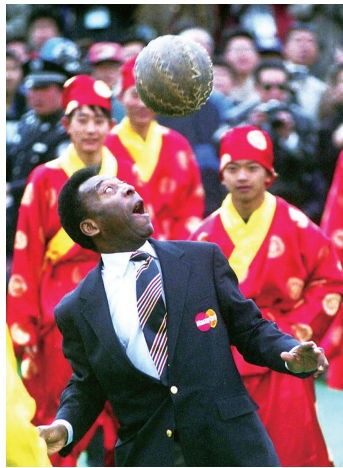
2002年3月16日,“球王”贝利在游览长城时体验蹴鞠。

那场比赛结束后,贝利在接受采访时说:“虽然我的腿有点儿伤,但面对这么多热情的观众,我很乐意出场为大家表演。来中国之前,我参加了1300多场比赛,踢进了1200多球。今天又在中国进球,我感到特别高兴。”9月21日下午,贝利跟随纽约宇宙队乘机离开中国。