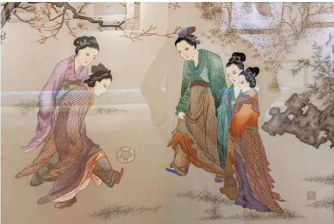
明朝画家杜堇的《仕女蹴鞠图》(局部)。

据南宋风俗文献《梦粱录》记载，南宋杭州城里有几家出名的茶坊，包括“俞七郎茶坊”“朱骷髅茶坊”“一窟鬼茶坊”“黄尖嘴蹴球茶坊”等等。其中“俞七郎茶坊”是按茶坊老板的排行取名，“朱骷髅茶坊”和“一窟鬼茶坊”是按南宋话本小说取的名字（《朱骷髅》和《西山一窟鬼》是南宋初年最卖座的恐怖小说，其流行程度不亚于现代的《盗墓笔记》），而“黄尖嘴蹴球茶坊”则是靠球星冠名——黄尖嘴是南宋杭州民间足球俱乐部里的知名球星，颇受当时市民追捧，所以茶坊老板才会用他的名字给自家店铺冠名。