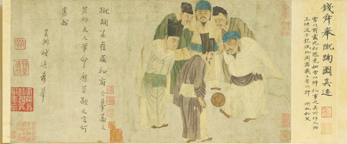
元朝画家钱选绘摹的《宋太祖蹴鞠图》。

足球在中国起源很早，球迷文化同样很早，据汉朝笔记小说集《西京杂记》描述，汉高祖刘邦的父亲就是一个球迷。