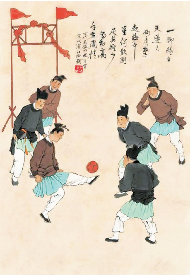
宋朝人踢足球的场景，出自王弘力《古代风俗百图》。