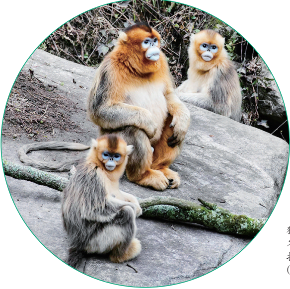
这是在大熊猫国家公园甘肃省片区裕河园区拍摄的川金丝猴(1月4日摄)。