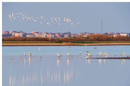
众多候鸟在江西鄱阳湖南矶湿地国家级自然保护区的湿地栖息(2022 年 11 月 11 日摄)。