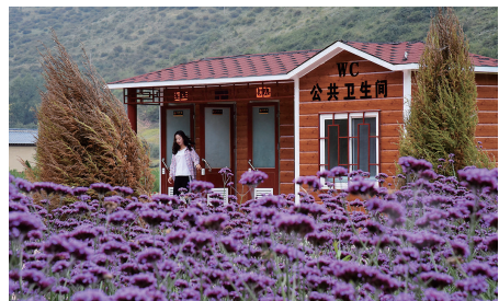
甘肃省甘南藏族自治州临潭县八角镇“八角花谷”内新修建的旅游公厕(2019 年 9 月 5 日摄)。