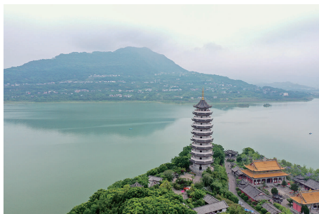
重庆市开州区汉丰湖国家湿地公园(2020 年 5 月 22 日摄,无人机照片)。