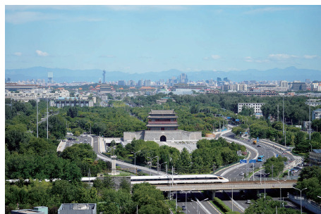
一列复兴号列车从北京永定门城楼前驶过(2022 年 8 月 16 日摄)。