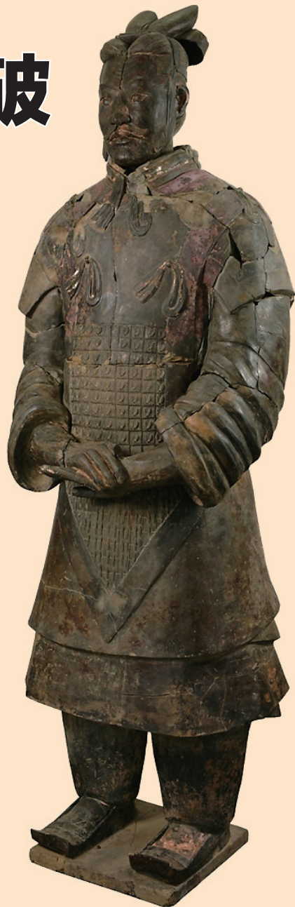
发掘发现的将军俑。

秦兵马俑陪葬坑是秦始皇帝陵园外围的一组大型陪葬坑,其中一号坑面积最大,平面呈长方形,总面积14260平方米,按照排列密度估算,全部发掘后可出土陶俑、陶马约6000件。