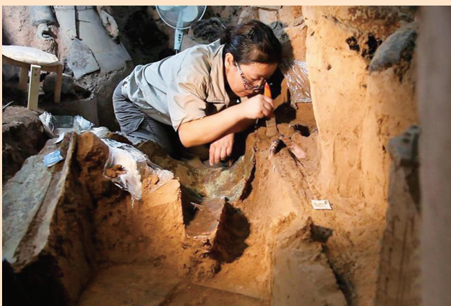
考古人员正在发掘区工作。