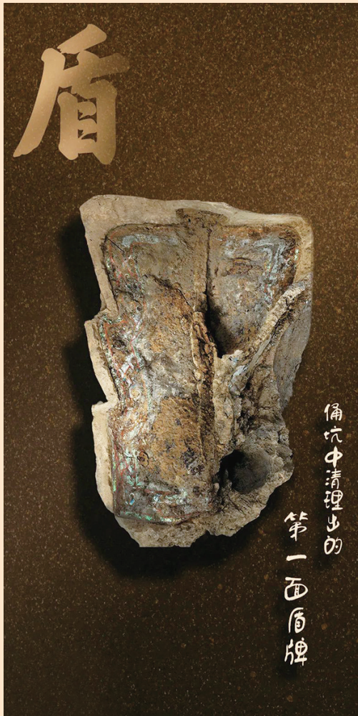
考古发掘发现的盾。