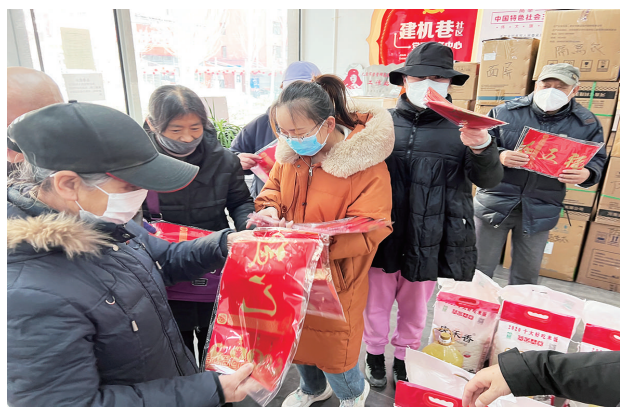
春节将至,年味渐浓。1月17日,建机巷社区为辖区困难居民送去米面油和春联等慰问品,并记录下他们的具体困难与需求,将逐一落实解决。