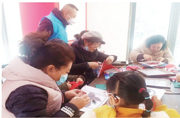
为弘扬中华优秀传统文化,营造喜庆祥和的节日氛围,1月17日上午,中车社区邀请辖区居民在社区党建活动室开展“迎新春,秀剪纸”活动。