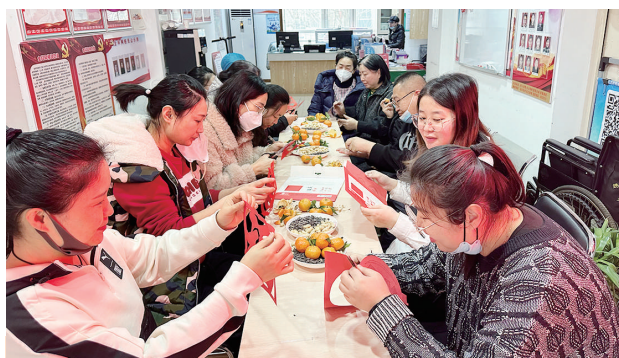
为增进邻里情和社区凝聚力、向心力。1月17日,坞城街道学府街东社区召开“党群连心 共迎新春”茶话会,邀请辖区居民代表、驻地单位负责人、商户代表欢聚一堂,共贺新春,共议新年社区发展事宜。