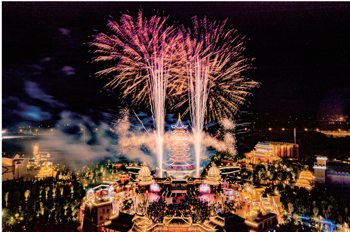
图为春节假日,太原方特绚丽多彩的夜景。

客乘坐大型立体轨道车,走进陈列众多中华传世名画的“丹青阁”,欣赏历代绘画名作和艺术珍品,感受中华民族绚丽多彩的艺术魅力。《女娲补天》同样不容错过,游客乘坐“救世方舟”,跟随女娲亲临上古洪荒地界,迎战祝融、共工,最终夺取五彩石,飞跃不周山,经历了一场炼石补天、拯救苍生的历险之旅。