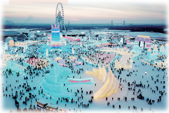
↑ 1月25日,游客在哈尔滨冰雪大世界园区内游玩(无人机照片)。