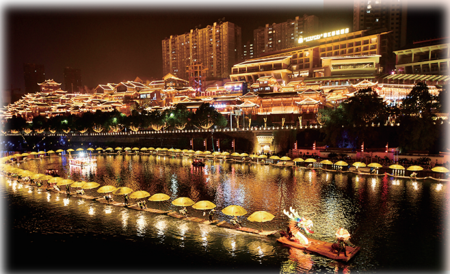
1 月 28 日,游客在宣恩县仙山贡水旅游区乘坐“贡水游龙”赏夜景。