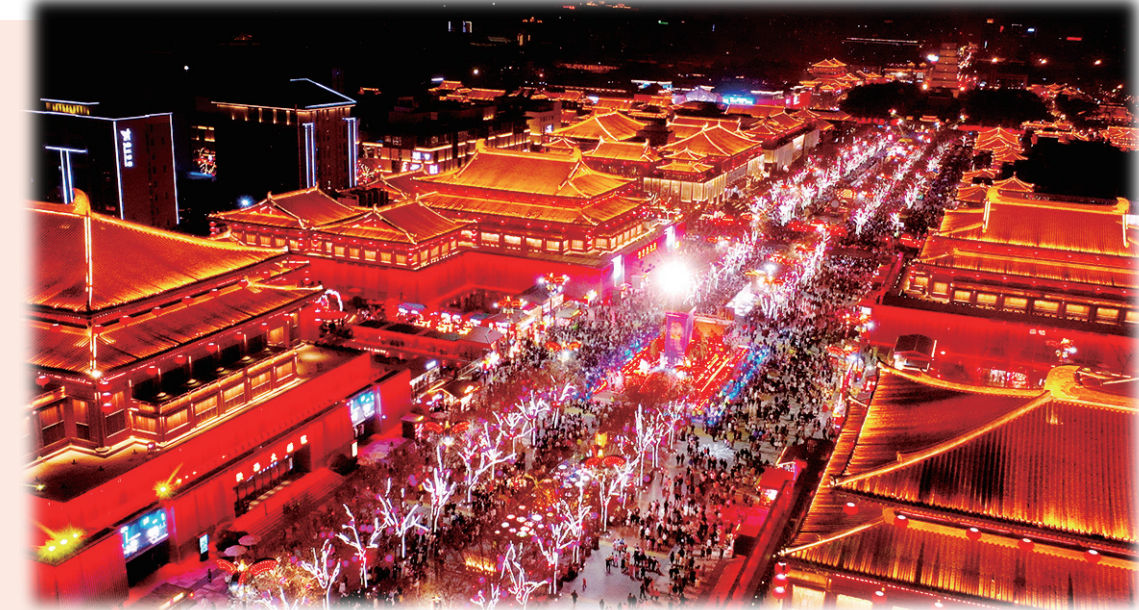
西安大唐不夜城步行街区(无人机照片)。

中国旅游研究院院长江旅游研究基地首席专家罗兹柏建议,各地加强旅游信息宣传引导,既要有“网红”目的地引流,也要有特色“平替”景区可去。同时,建议主管部门加强市场细分引导,推动景区依分众化、小众化方向提升品质,为游客打造更多沉浸式的旅游体验。