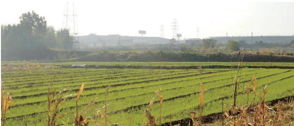
在岳飞短暂而辉煌的一生中，“磁州贺兰山”占据了重要一页，也是他早期戎马生涯的活动中心。

经典的“三选一”，究竟哪里才是“正牌”呢？主流声音依然是“宁夏一带的贺兰山”，尽管还要面对“岳飞从未到过那里”“攻打金国怎么跑到西夏去了”等质疑。更有好事者抛出了“绝杀之问”——如果你只差 0.5 分考上清北复交，而试卷上只剩下一道 1 分的填空题，“驾长车踏破贺兰山缺”中的贺兰山在哪里，你会填什么？标准答案就摆在那里。