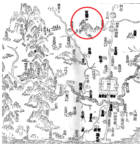
清康熙二十四年州境图

随着张艺谋导演的电影《满江红》称霸今年的春节档，南宋名将岳飞的同名词牌成为热搜，岳飞的故乡汤阴也推出了“背《满江红》免门票”活动。与此同时，一个老生常谈的话题不可避免地再次摆在了人们面前——岳元帅欲“驾长车踏破贺兰山缺”中的“贺兰山”，到底在哪里？