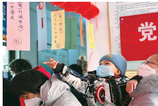
猜灯谜闹元宵活动现场。

本报讯(记者 周利芳 通讯员 郭芳芳 文/摄)为传承和弘扬中华优秀传统文化,营造欢乐喜庆、和谐文明的节日氛围,2月1日上午,平阳路街道长风社区举办的“党建引领心连心 邻里欢聚闹元宵”猜灯谜活动,吸引了辖区内80多个家庭和多家驻地单位积极参与。